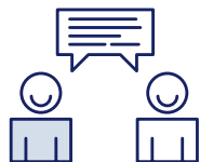
Dialog mit Ausbildern

Als Familienunternehmen fühlen wir uns dem Morgen verpflichtet. Nachhaltigkeit ist für uns von hohem Wert – gerade im Umgang mit Menschen. Wir investieren viel in Ihre Qualifikation und hoffen, Sie langfristig für uns gewinnen zu können.