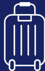
6 Wochen Urlaub