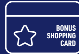
Bonus Shopping Card